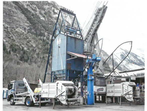
Absetzkipper mit Spezialaufbau für die Müllentsorgung über die Schilthornbahn in Mürren.