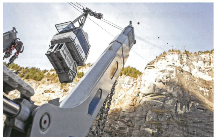
Abtransport der leeren Müllmulde nach Mürren.

Bahn transportiert werden kann. Darauf hat sich die Steiner Transporte AG eingerichtet. Mit den Spezialaufbauten von UT und einer grossen Auswahl an unterschiedlichen Mulden kann die Müllentsorgung mit demselben Absetzkipper vorgenommen werden wie die Versorgung mit Baumaterialien während der Bauzeit im Sommer. So deckt der gleiche Fahrer ein extrem breites Aufgabengebiet ohne Unterbrechung ab, und der Absetzkipper verzeichnet keinen Leerlauf. Diese Flexibilität erleichtert den Arbeitsalltag sehr. ■