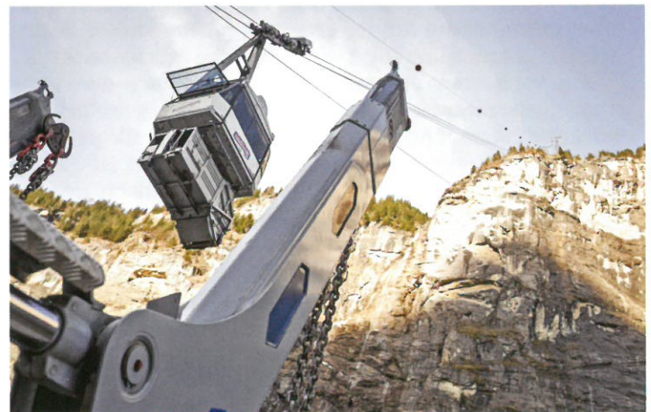
Abtransport der leeren Müllmulde nach Mürren.

Bahn transportiert werden kann. Darauf hat sich die Steiner Transporte AG eingerichtet. Mit den Spezialaufbauten von UT und einer grossen Auswahl an unterschiedlichen Mulden kann die Müllentsorgung mit demselben Absetzkipper vorgenommen werden wie die Versorgung mit Baumaterialien während der Bauzeit im Sommer. So deckt der gleiche Fahrer ein extrem breites Aufgabengebiet ohne Unterbrechung ab, und der Absetzkipper verzeichnet keinen Leerlauf. Diese Flexibilität erleichtert den Arbeitsalltag sehr. ■