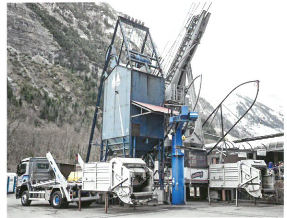
Absetzkipper mit Spezialaufbau für die Müllentsorgung über die Schilthornbahn in Mürren.